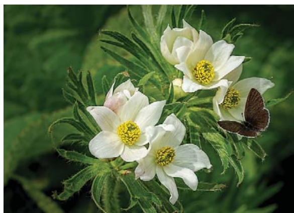
Foto scattata il 24 giugno 2020 nei pressi del Passo di Crocedomini in provincia di Brescia